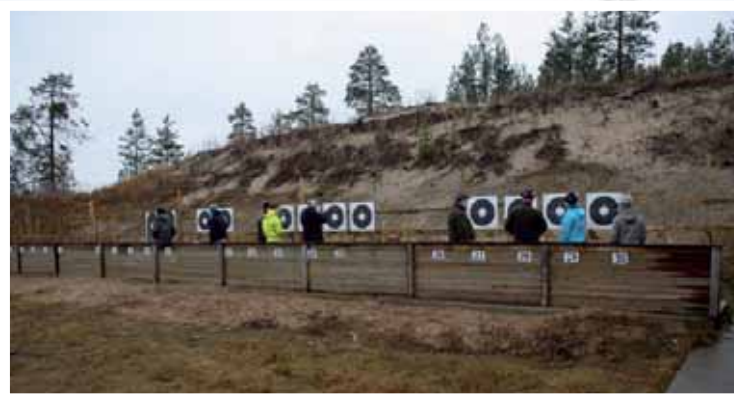
Kerhon ammunntatoimintaa 2011.

Liitto seuraa jäsenyhdistystensä aktiivisuutta ns. prosenttiammunnan kautta. Kerhot ja piirit kilpailevat keskenään siitä kuinka suuri osa jäsenistä tehnyt ainakin yhden ampumasuorituksen kerran vuodessa. Tämän vuoksi toivoisin