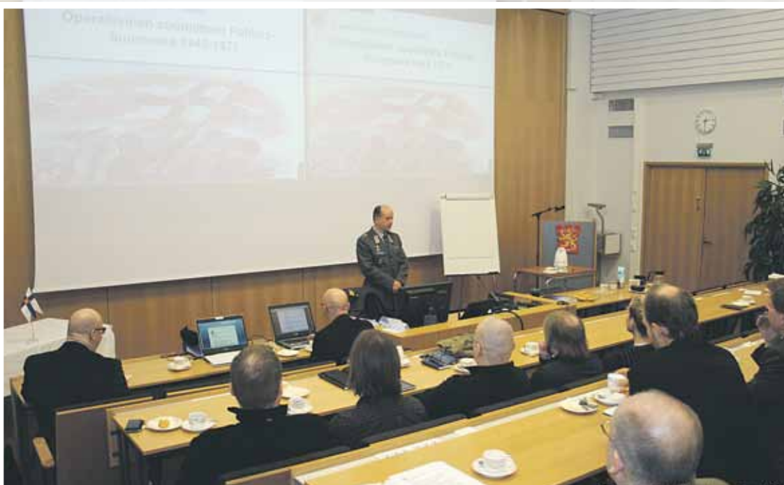
Oulun Reserviupseerikerho ry:n syyskokouksessa esitelmöi everstiluutnantti Kimmo Rajala.

Viisi eniten kuntosuorituksia kerännyttä palkitaan vuosittain kevätkokouksen yhteydessä. Lisäksi 5 kertaa yli 150 pistettä keränneet palkitaan mestariluokan mitalilla ja 15 kertaa yli 150 pistettä keränneet suurmestariluokan mitalilla.